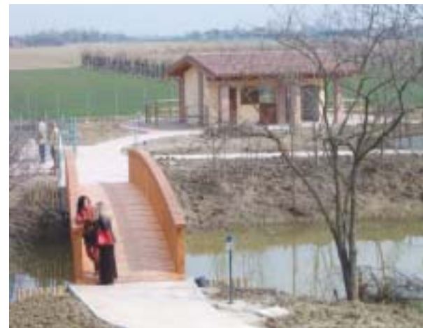
Veduta panoramica del giardino

Il fabbricato inaugurato è un importante spazio operativo in armonia, al suo interno, con tutte le attività svolte e, all'esterno, con l'ambiente limitrofo. Ecco quindi la scelta di utilizzare le tecniche della bioarchitettura, cioè risorse energetiche rinnovabili e pulite e materiali naturali e biocompatibili. La "Casa", oltre ai classici pannelli solari per l'acqua calda, ha un impianto di riscaldamento con caldaia a condensazione e pannelli radianti a pavimento. Anche il sistema di depurazione delle acque e di smaltimento dei rifiuti sono frutto di un progetto di compatibilità, per fare della "Casa" un luogo sano