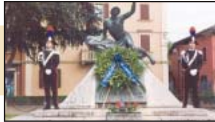
61° anniversario della liberazione