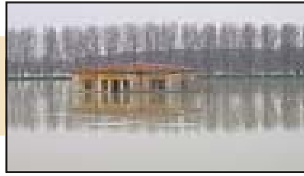
Guida Protezione Civile