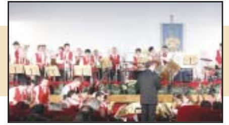
Appuntamenti di Natale