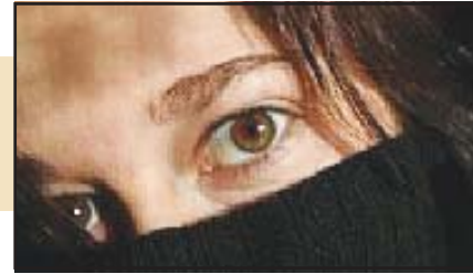
Violenza alle donne