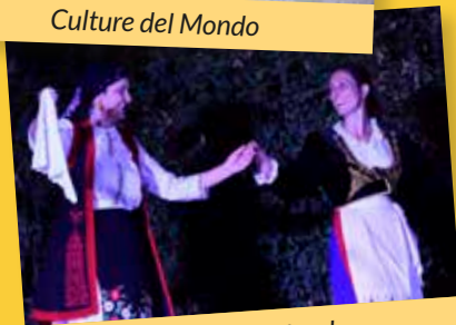
Culture del Mondo