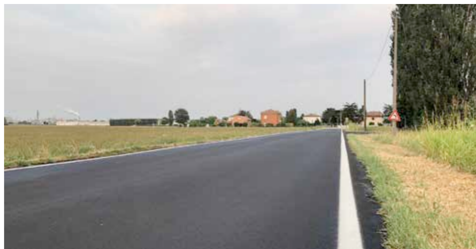
Rifacimento del manto stradale di parte di via Mora

Le modifiche vertono a mitigare quanto più possibile le ripercussioni sul traffico, in particolare, per quanto attiene il territorio di Minerbio è stato istituito sulla via Canaletto, per i soli autocarri, il senso unico. I camion potranno pertanto percorrere la strada provinciale "del Canaletto" esclusivamente in entrata a Minerbio, ovvero provenendo dalla strada statale "Porrettana" o da Bentivoglio. Il ritorno è stato previsto su altre strade, in particolare sulla Baricella-Altedo per quanti provengono da Nord, si passerà invece da Maddalena di Cazzano per portarsi a Sud. Alla modifica della circolazione si aggiungono anche alcuni interventi di riasfaltatura e di implementazione della sicurezza, in particolare si segnala la realizzazione