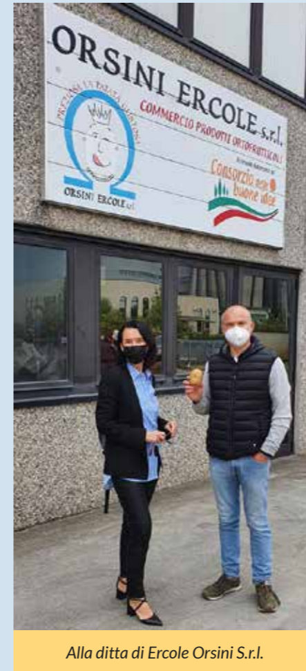
Alla ditta di Ercole Orsini S.r.l.

Orsini Ercole S.r.l. è una realtà imprenditoriale insediata sul territorio comunale che sta trasmettendo la passione dell'attività di generazione in generazione.