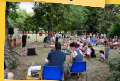
Dolce Fiera 2021