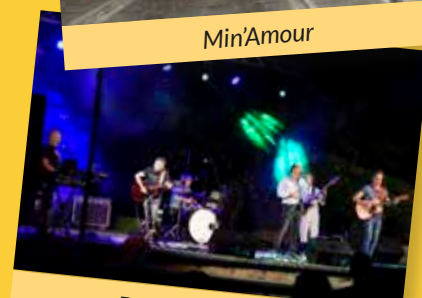
Dolce Fiera 2021