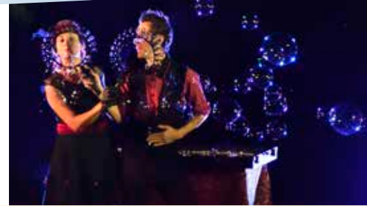
Le più belle foto dell'estate 2021

Cari Concittadini, mentre vi scrivo siamo nel cuore dell'estate, un'estate che è con tutti i suoi eventi una grande scommessa per la nostra Amministrazione. Abbiamo scelto di investire su questa stagione per ricominciare insieme a voi a vivere la città e tutte le sue opportunità. Le manifestazioni che abbiamo organizzato sono e saranno la piacevole occasione per incontrare molti di voi. Alcuni di questi eventi rappresentano la nostra tradizione, altri una novità, ma in tutti abbiamo provato a inserire un'impronta d'Innovazione.