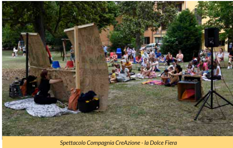
Spettacolo Compagnia CreAzione - la Dolce Fiera

Le tantissime persone per le vie di Minerbio, tra "notte bianca" con i negozi