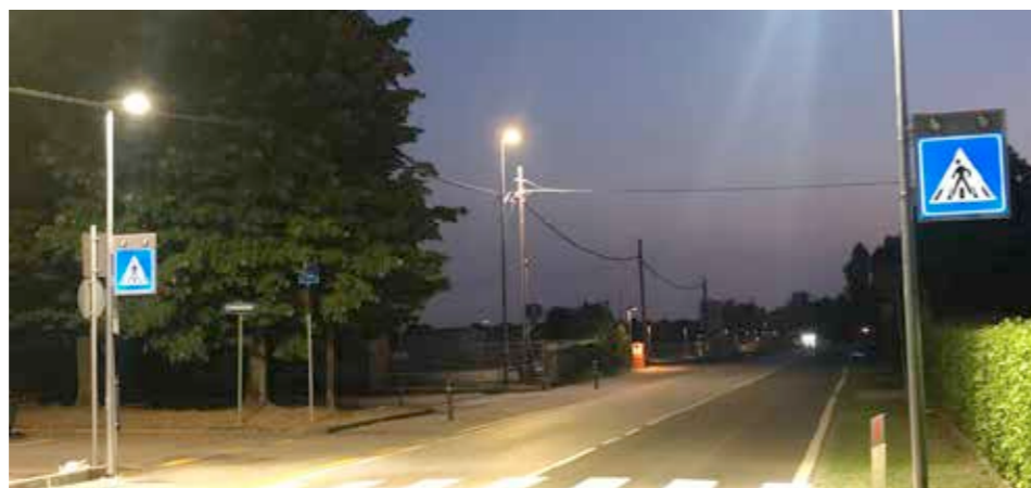
Nuovo attraversamento pedonale a "Piazza Nuova"

di un nuovo attraversamento pedonale specificatamente illuminato a led a "Piazza Nuova" e il rifacimento del manto stradale di parte di via Mora.