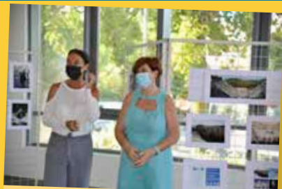
Culture del Mondo