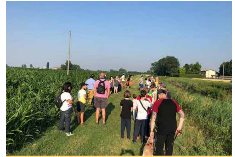
Passeggiata "Argini in pianura"