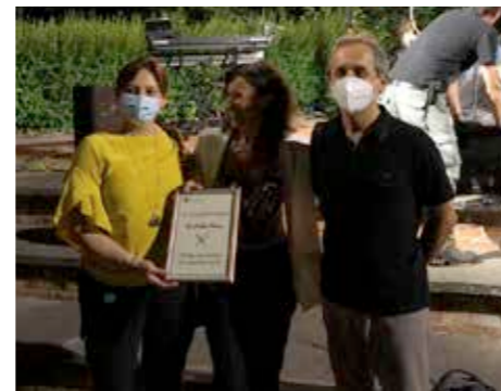
Premiazione Dolce più buono di Minerbio 2021