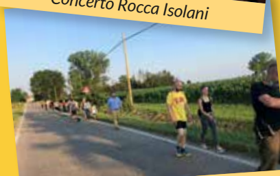
Argini in Pianura