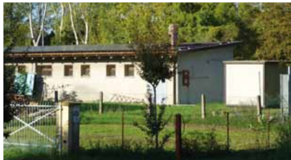
Pannelli solari sul tetto degli spogliatoi del centro sportivo Daniele Passarini

Il Sindaco Lorenzo Minganti ha aggiunto: "E' un'ottima notizia sia per l'ambiente che per la salute: abbiamo lavorato duramente, nonostante i limiti del patto di stabilità, per far sì che sopra la testa dei nostri ragazzi ci fossero dei pannelli solari anziché delle lastre di eternit. Bisogna ricordare che l'eternit, un materiale molto usato in passato, quando inizia a sgretolarsi può diventare molto pericoloso per la salute. Sfruttando le agevolazioni del conto energia abbiamo realizzato un impianto che si ammortizzerà in circa 15 anni restituendo al Comune ed alla società sportiva quanto ha speso tramite risparmi sulla bolletta elettrica. In questi anni abbiamo rimosso quasi tutto l'eternit presente su edifici comunali: continuando così entro la fine del mandato amministrativo saremo un comune senza più eternit sugli edifici pubblici. Speriamo che questo intervento sia di esempio per tutti coloro, soprattutto capannoni, che si trovano ancora oggi dei tetti in eternit."