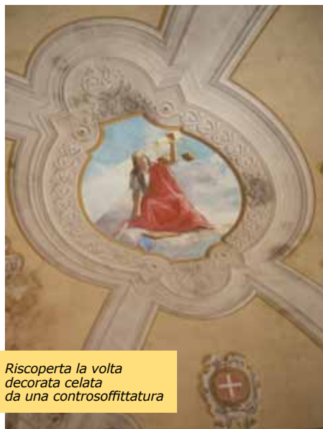
Riscoperta la volta decorata celata da una controsoffittatura

Il Palazzo municipale, III lotto, a seguito degli eventi sismici dello scorso 20 e 29 maggio ha subito un rilevante aggravio delle condizioni generali, scaturito dalle vulnerabilità che una struttura storica come questa presenta, oltre che da una maggiore marcatura delle lesioni preesistenti e dalla comparsa di nuove. Tale contesto, pregiudicando l'incolumità delle persone che vi lavorano e che ogni giorno vi si recano, ha costretto il Sindaco, lo scorso 31 maggio, a dichiarare l'inagibilità del fabbricato, ed il contestuale sgombero immediato. Successivamente la Protezione Civile ha redatto la scheda AeDES esprimendo con essa un giudizio d'inagibilità , confermando pertanto quando precedentemente dichiarato dal Sindaco.