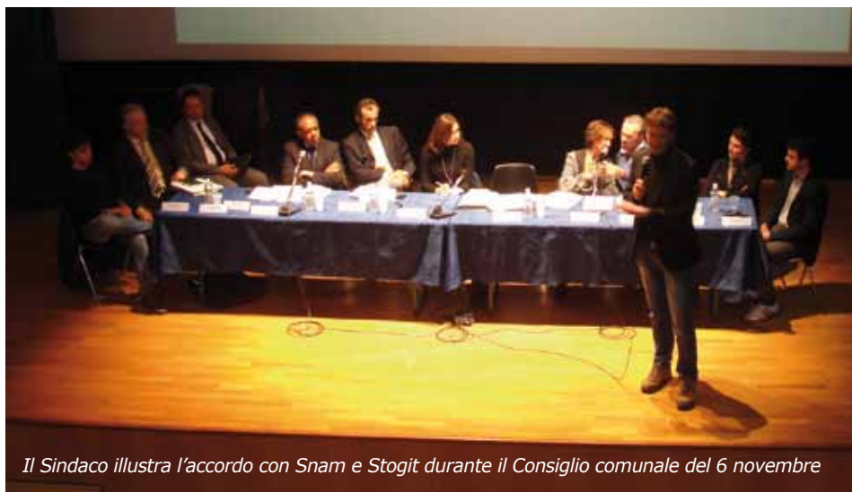
Il Sindaco illustra l'accordo con Snam e Stogit durante il Consiglio comunale del 6 novembre