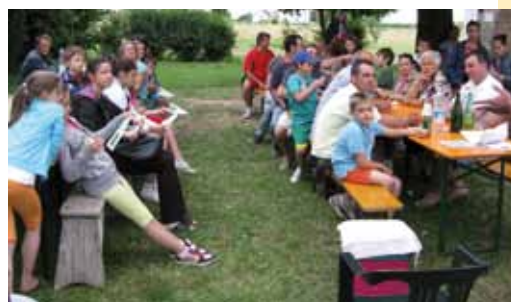
I partecipanti alla gara di pesca per ragazzi

Se volete saperne di più visitate il sito internet del Comune alla pagina http://www.comune.minerbio.bo.it/assosport/