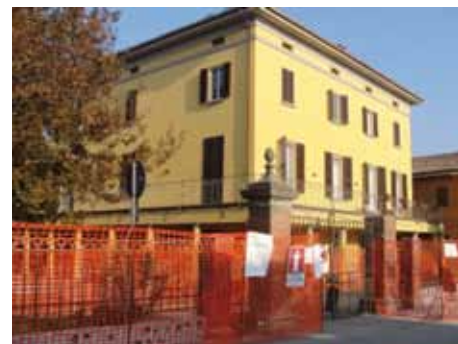
Restauro cancellata Parco 2 Agosto 1980

Per festeggiare i suoi 15 anni di attività il Centro Sociale "Primavera" ha voluto regalare a tutta la Comunità un'opera di grande valore: il restauro della cancellata del Parco 2 Agosto 1980. Grazie a questo intervento, sarà valorizzato l'ingresso nel cuore della nostra città.