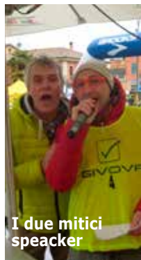
I due mitici speaker