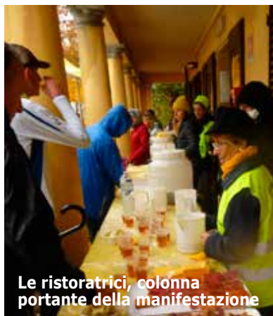
Le ristoratrici, colonna portante della manifestazione