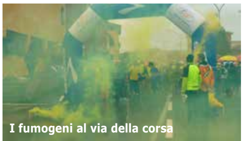
I fumogeni al via della corsa