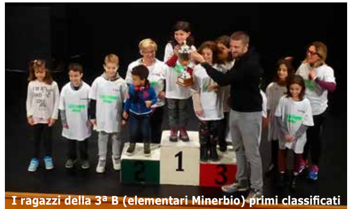
I ragazzi della 3 a B (elementari Minerbio) primi classificati