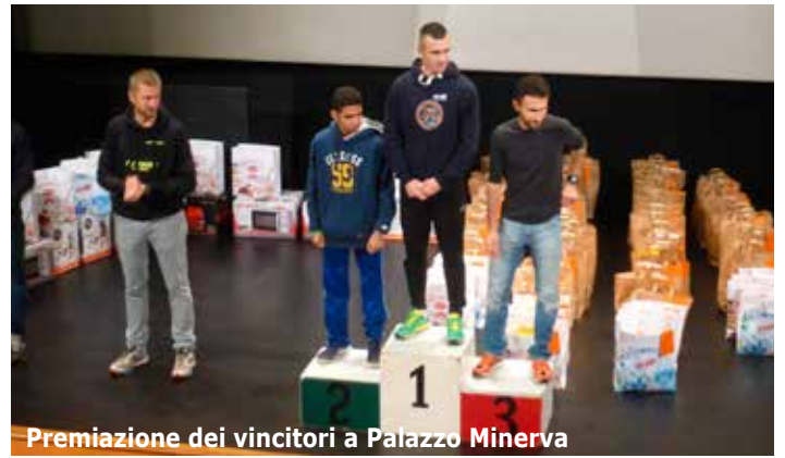
Premiazione dei vincitori a Palazzo Minerva