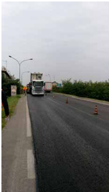
Asfaltatura sul ponte di via Ronchi Inferiore a Cà de Fabbri

- manutenzione manto d'asfalto in via Ronchi Inferiore : rifacimento del manto bituminoso in molteplici porzioni di strada gravemente danneggiata per una spesa di € 55.000: FINITO