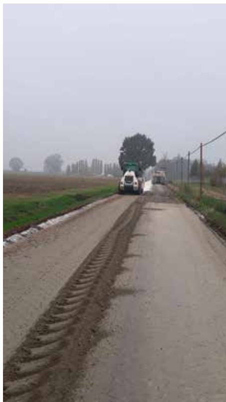
Trattamento a calce per il consolidamento di via Palio