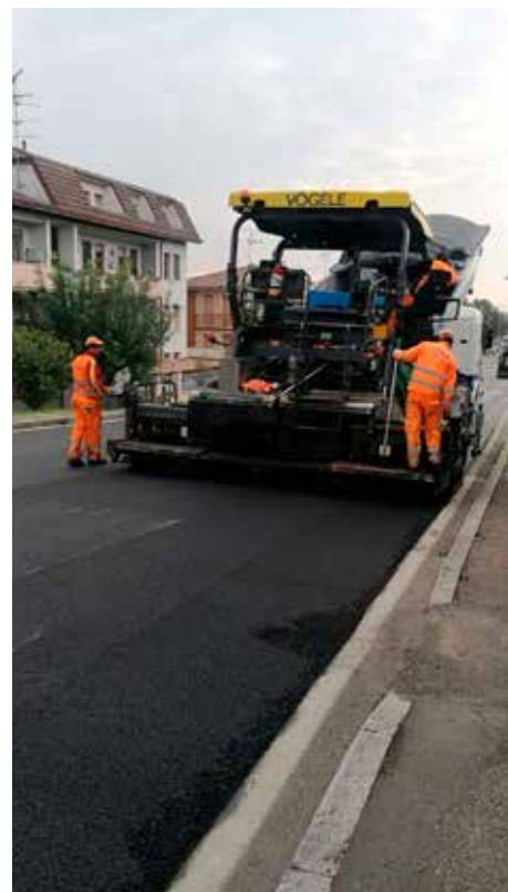
Asfaltatura di via Ronchi Inferiore a Cà de Fabbri