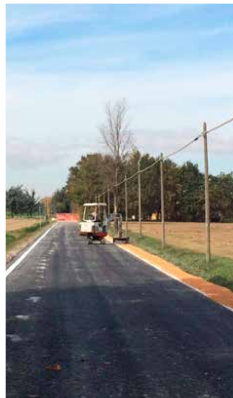
Reintegro della banchina di via Palio ad asfaltatura completata