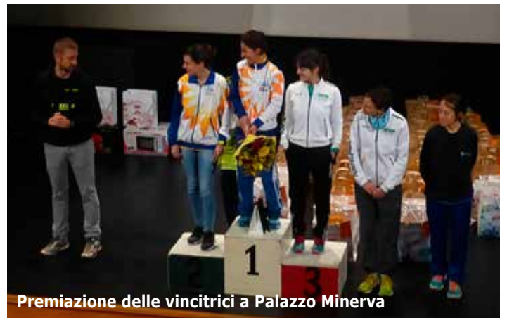
Premiazione delle vincitrici a Palazzo Minerva