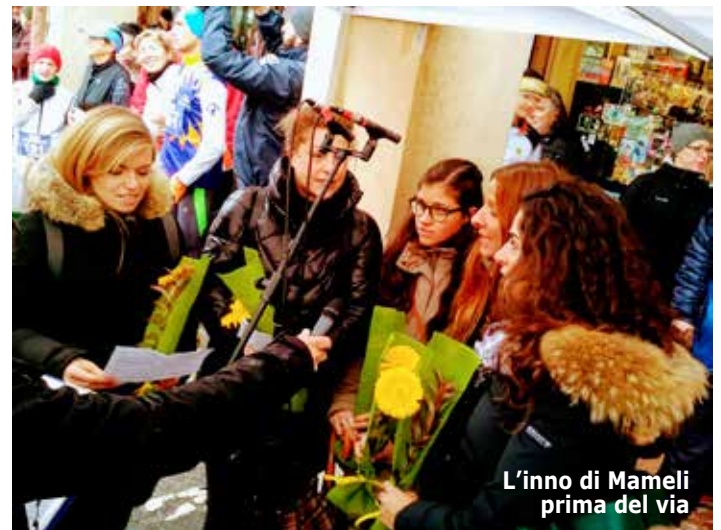
L'inno di Mameli prima del via