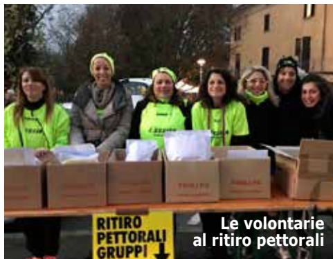
Le volontarie al ritiro pettorali