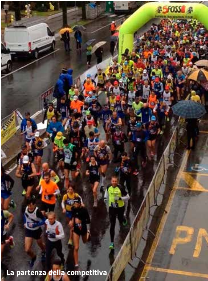
La partenza della competitiva