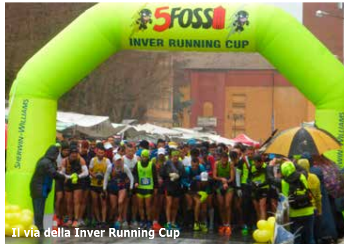
Il via della Inver Running Cup