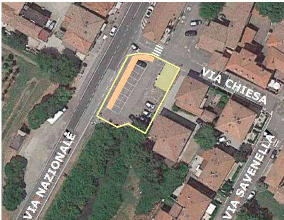
Nuovo layout del parcheggio di via Nazionale a Cà de Fabbri

Cà de Fabbri o al ripristino della pavimentazione del marciapiede di via Fosse a Minerbio - e prosegue - anche in questo ambito, con gli interventi appena ricordati è stata rivolta particolare attenzione alla categoria dei fruitori della strada più fragile: le persone a piedi.