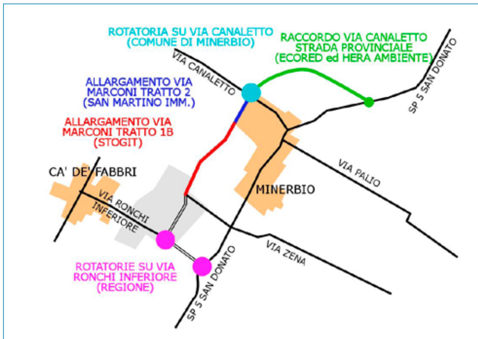
Schema della nuova circonvallazione

Il tratto di via Marconi da allargare compreso fra via Solidarietà e la rotonda di via Canaletto è invece posto a carico dell'immobiliare San Martino quale condizione di sostenibilità del comparto urbanistico n. 8 previsto dal POC 2 (da realizzarsi proprio all'angolo fra via Marconi e via Canaletto). Il collegamento fra la rotonda di via Canaletto e la Strada Provinciale San Donato dovrebbe invece essere assicurato da una nuova bretella, che