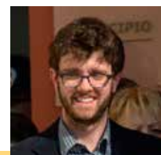
Fabrizio Tugnoli Assessore ai Lavori Pubblici e servizi tecnico manutentivi