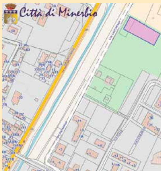
Individuazione dell'area sgambamento cani

Il progetto prevede oltre alla delimitazione dell'area con apposita recinzione, la realizzazione di un camminamento in battuto di ghiaia stabilizzata, di un impianto di illuminazione pubblica dedicato, la posa di due fontane e dell'arredo urbano a disposizione dei frequentatori del parco. L'opera avrà un