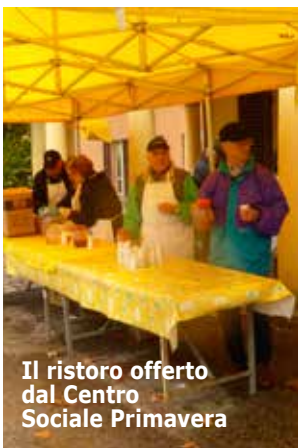
Il ristoro offerto dal Centro Sociale Primavera