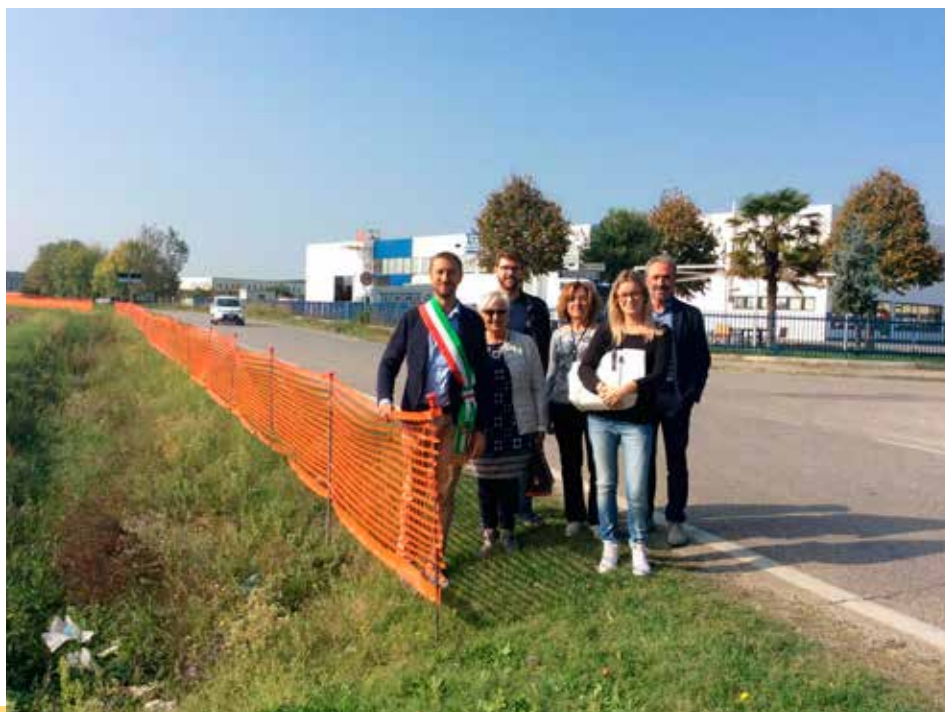
L'inaugurazione dell'avvio dei lavori della nuova circonvallazione da parte dell'amministrazione comunale

Infine le intersezioni di via Ronchi Inferiore saranno messe in sicurezza e rese più scorrevoli tramite due rotonde da realizzarsi grazie ad un finanziamento della Regione Emilia-Romagna da 2 milioni di Euro finalizzato a migliorare l'accesso allo zuccherificio di Minerbio; tale finanziamento servirà anche per realizzare un nuovo collegamento fra la Provinciale San Donato e lo zuccherificio stesso.