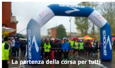
La partenza della corsa per tutti