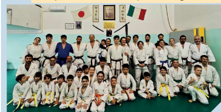
14 Aprile - Minerbio - Dojo Luca Bottoni