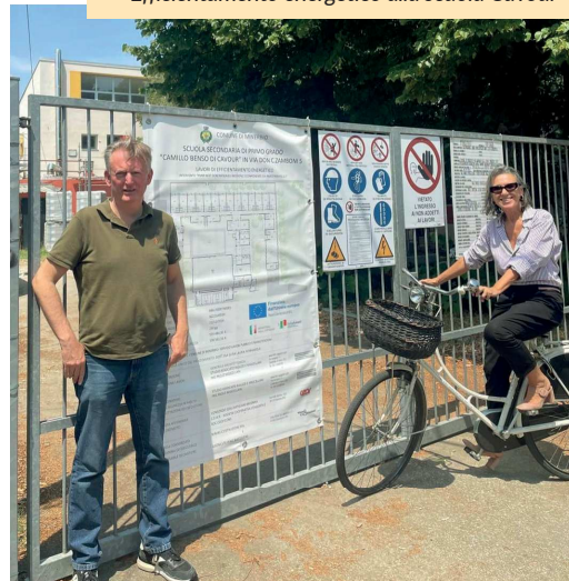
Efficientamento energetico alla scuola Cavour

sonale scolastico e sul contenimento dei consumi energetici. L'attenzione al benessere di chi frequenta la scuola è al centro di questo progetto, che si accompagna a una serie di opere accessorie volte a garantire l'efficienza e la piena funzionalità della struttura.