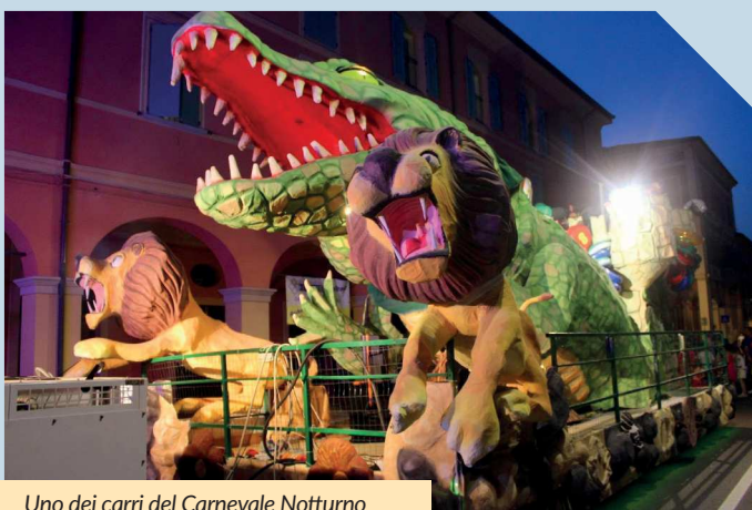
Uno dei carri del Carnevale Notturmo