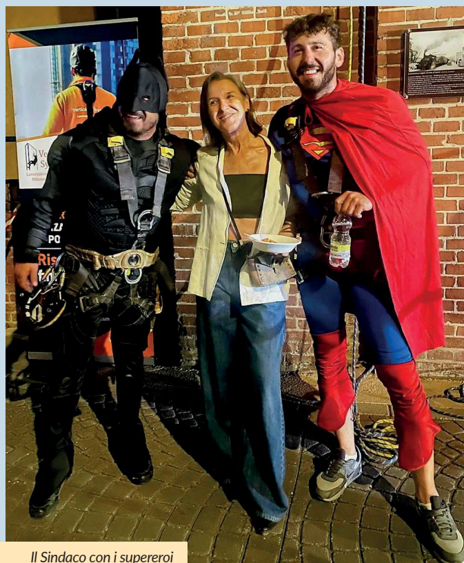
Il Sindaco con i supereroi