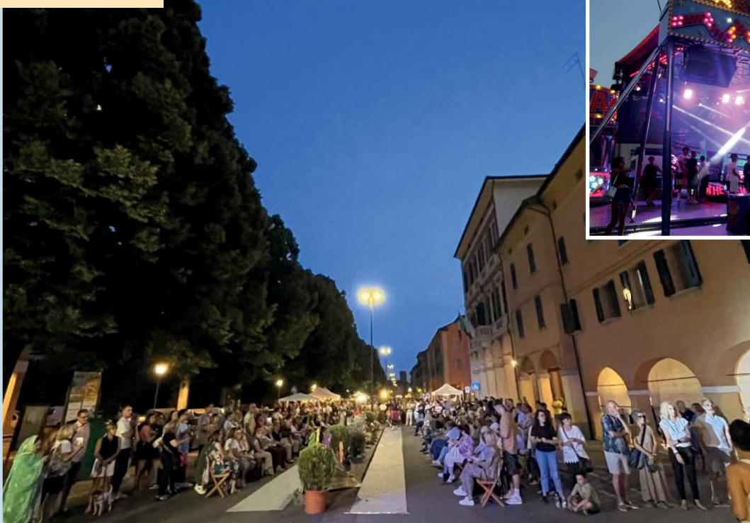
La sfilata di moda