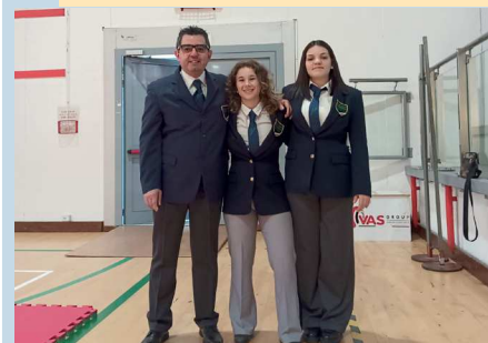
6 Aprile - Altedo - Campionati Regionali UISP